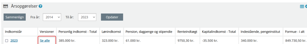
Figur 5 - Se alle versioner af en årsopgørelse

Hvis der for det samme indkomstår eksisterer mere end én version af årsopgørelsen vil du under kolonnen "Versioner" (Vist på Figur 5) kunne se et link ved navn "Se alle", der vil give dig muligheden for at vælge hvilke versioner, af årsopgørelsen for det valgte indkomstår, du ønsker vist.