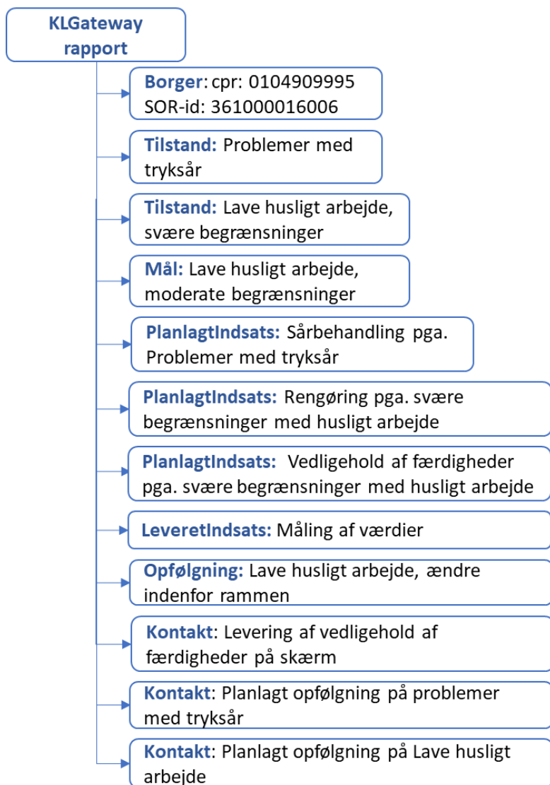
Figur 1 - Illustration af KGateway rapport på overbliksniveau for eksemplet med borger Sverre.